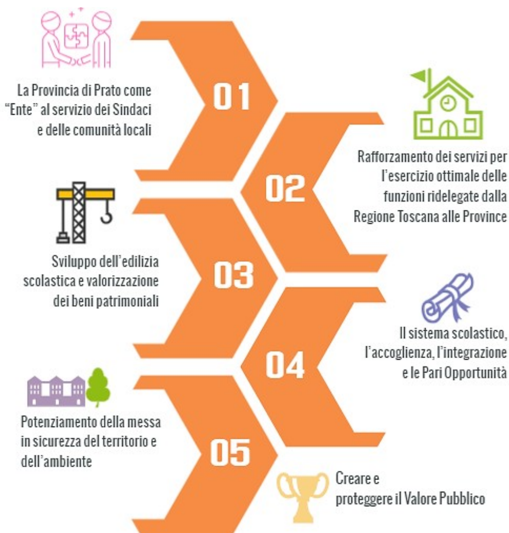
Figura 1 Le 5 Missioni di mandato.

Esse si articolano in 5 missioni nelle quali si sviluppano 3 obiettivi di Valore Pubblico, sintetizzati nelle seguenti figure.