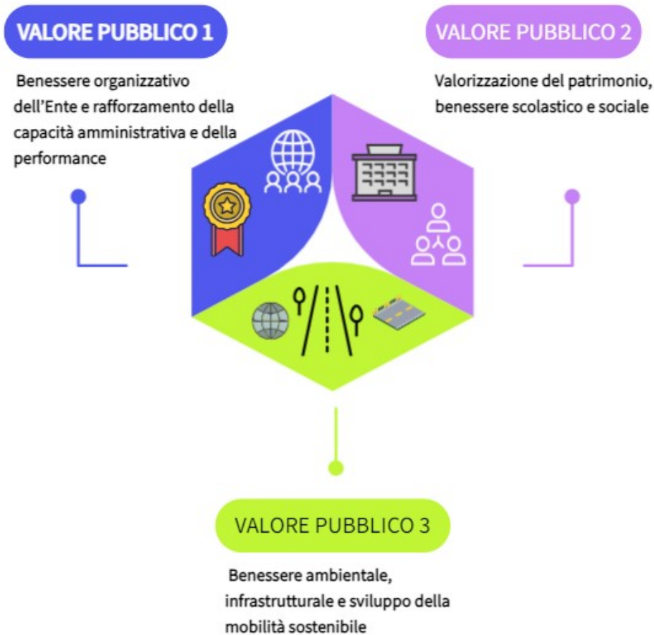
Figura 2 Obiettivi di Valore Pubblico.

Dunque, partendo dall'analisi del contesto e delle aspettative della comunità locale, si procede con la definizione degli obiettivi strategici, che rappresentano le mete da raggiungere nel medio e lungo termine.